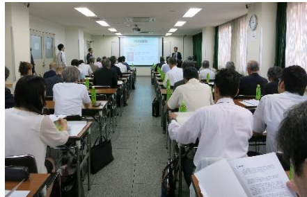
未来教育研究会の様子